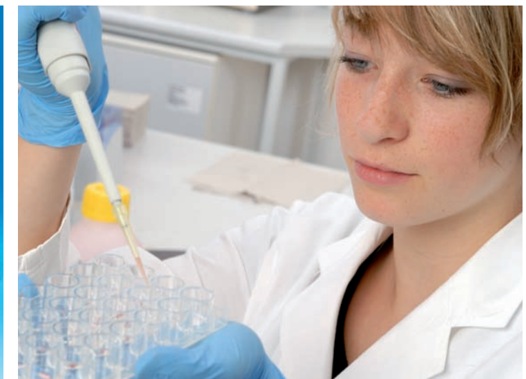
Experimentieren mit dem PHYWE bachelor course