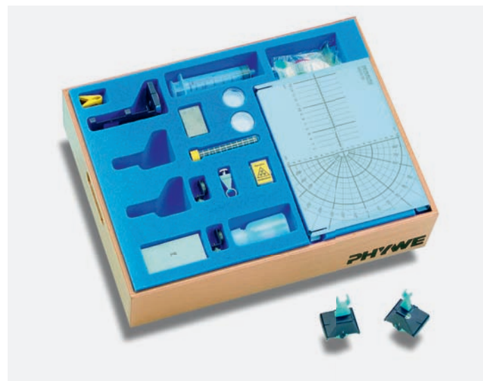
Abb: TESS Radioaktivität – zur Untersuchung der radioaktiven Grundgesetze