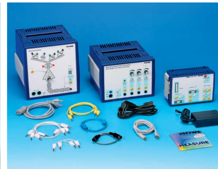
Abb: Neurobiologie-Labor – mehr als 30 Versuche zu Nervenzellen und ihren Wechselwirkungen mit neuronalen Netzen