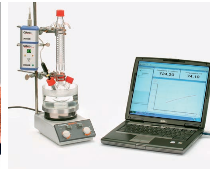
Abb: Versuch zur Temperaturabhängigkeit der Leitfähigkeit