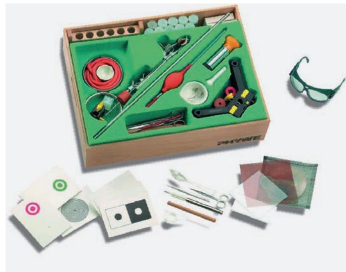
Abb: TESS Biologie II – 92 Versuche möglich