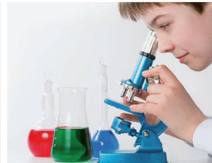
TESS-Experimente – Naturwissenschaften mit Spaß erleben